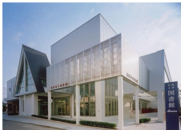
うおづしりつとしょかん

〒937-0805 富山県魚津市本江 1940 番地 TEL0765-22-0462 FAX0765-23-9165 E-mail: uozu-lib@city.uzoju.toyama.jp http://www.lib.city.uzoju.toyama.jp