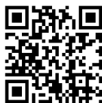
うおづ電子図書館 HP